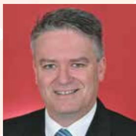
Senator the Hon. Mathias Cormann Finanzminister von Australien und Schirmherr der Konferenz