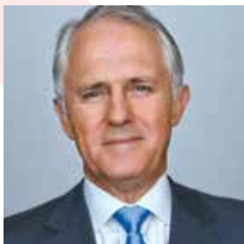
The Hon. Malcolm Turnbull MP Premierminister von Australien

Hochkarätige Gastredner aus Wirtschaft und Politik werden das Konferenzprogramm mitgestalten: