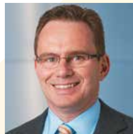
Andrew Mackenzie FRS CEO BHP und Präsident der AHK Australien