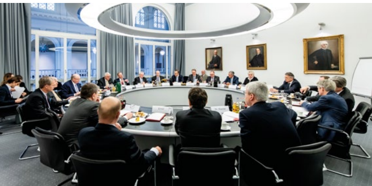
Round Table mit Vertretern diverser Unternehmen und Branchen