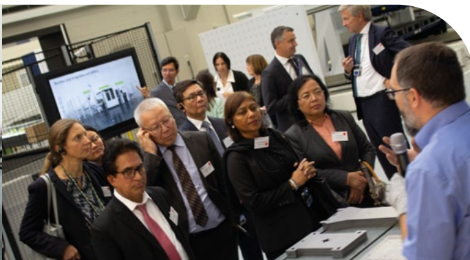
Eine Delegation asiatischer Botschafter während eines Unternehmensbesuches