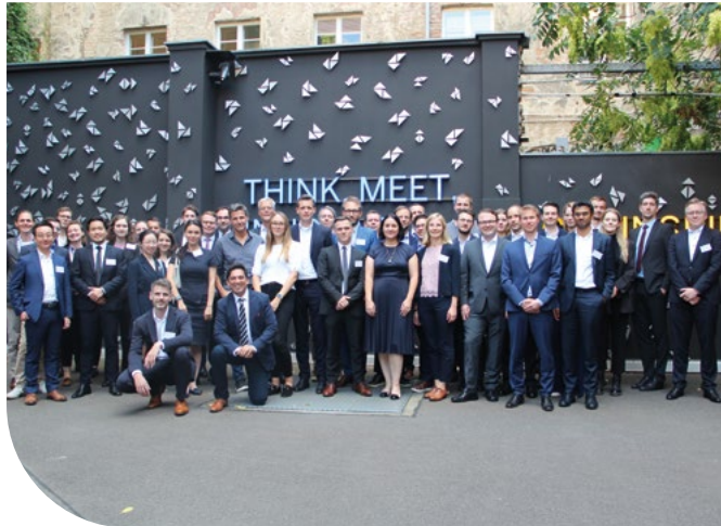
Die „OAV Young Leaders“ während der jährlich stattfindenden Jahreskonferenz